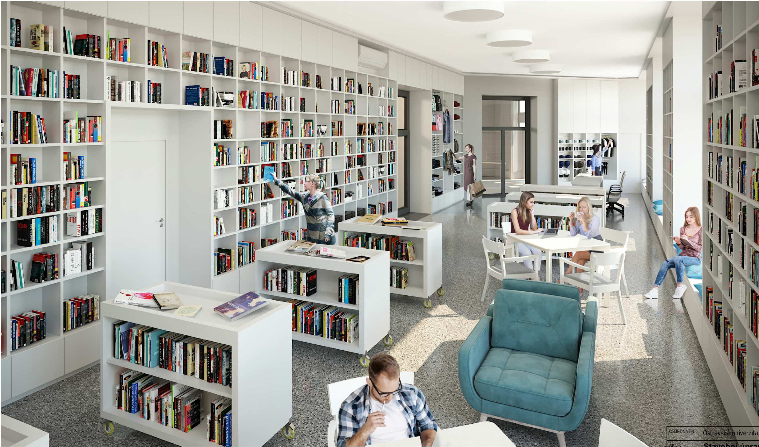
SO01 - 1NP 1.2